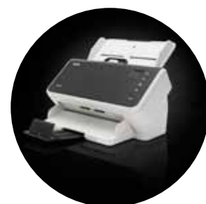
Scanner Alaris S2040/S2050/S2070