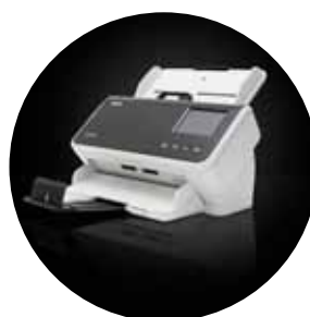
Scanner Alaris S2060w/S2080w